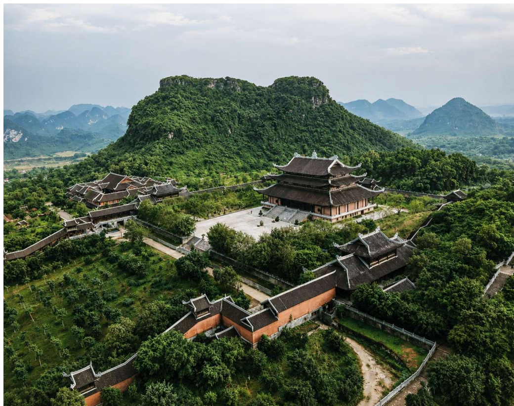
Старый монастырей на холме. Вьетнам.

широкое озеро вулканического происхождения. Вода там была удивительно прозрачна и чиста, как слёзы девушки. Подобно жемчужине, оно сверкало и переливалось с восходом солнца. Окружающая природа напоминала райский уголок. Даже грубый частокол монастыря сливался с растущими вокруг деревьями и кустами.